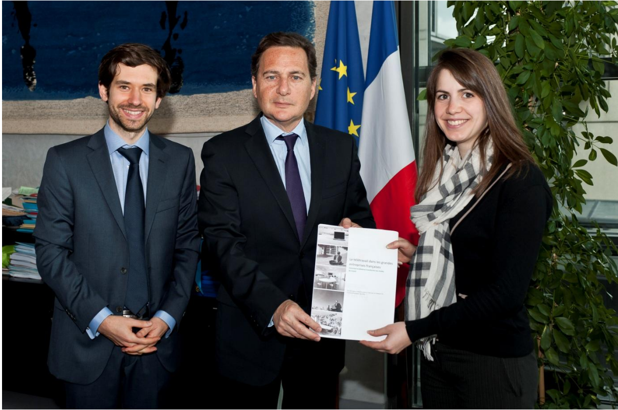
Remise officielle de l'étude sur le télétravail dans les grandes entreprises françaises à M. Eric Besson, Ministre chargé de l'Industrie, de l'Énergie et de l'Économie Numérique – 7 mai 2012